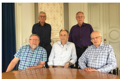
Delar av gruppen 5 juni 2018

Nu satsar vi på att bidra till en mångsidig valinformation genom att dagligen lyfta fram det bästa från Nya Media.